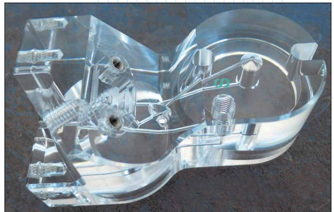
Прозрачная акриловая компонента медицинского устройства, изготовленная на одном из 5-осевых обрабатывающих центров компании Connecticut Plastics по УП, подготовленной в Mastercam Mill 3D и Multiaxis

компоненты лабораторного оборудования со сложными [для обработки] размерами, с очень глубокими просверленными отверстиями чистового качества, с поверхностями без дефектов”, – рассказывает г-н DiMaio . – “Они знают, как трудно сделать это. Пластмассовые заготовки при обработке очень чувствительны к высокой температуре и химикатам, очень варьируются по своим механическим характеристикам, и их очень трудно зафиксировать, не прикладывая слишком большого давления, которое может послужить причиной функциональных или косметических дефектов. Если стратегия обработки