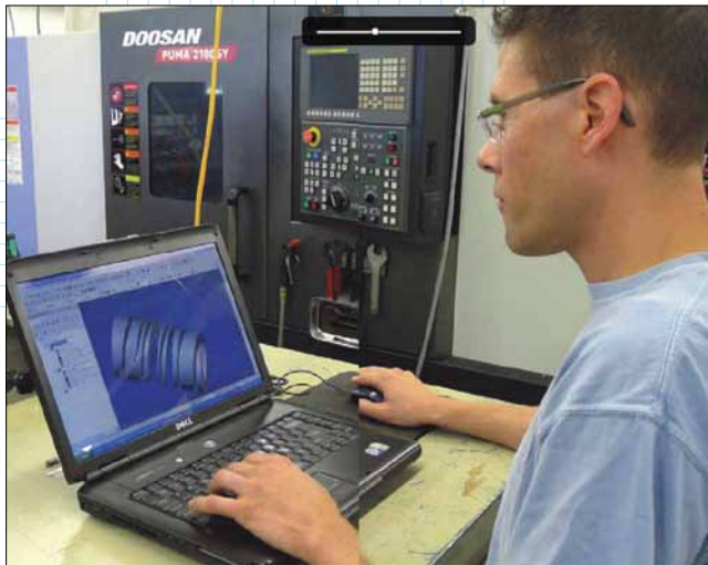
Процесс изготовления пружинной компоненты на станке Doosan с активным инструментом разрабатывался в среде Mastercam Lathe

разработана недостаточно тщательно, то при фрезерной или токарной обработке пластмассовые стенки и другие элементы могут быть повреждены. Но мы знаем, как справиться с этими и другими проблемами обработки деталей из пластика”.